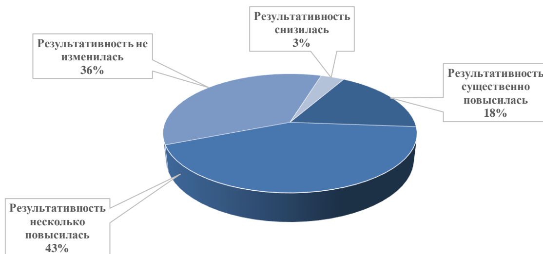
Рис. 3. Оценка результативности выполнения функций органами государственного-общественного управления образовательных учреждений